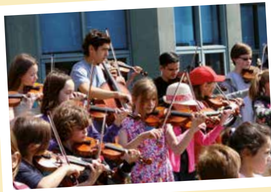
Les jeunes musiciens des Jeux d'archets Suzuki

attendait les familles à leur sortie. En guise de cadeau de bienvenue, chacune est repartie avec un arbre, symbole d'implantation dans notre belle municipalité.