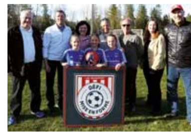
DÉFI MISE EN FORME Canac de soccer le 18 mai >