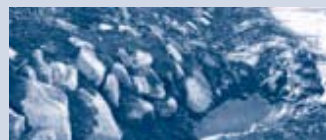
Les bassins de sédimentation, réalisés à l'aide d'enrochements et d'une membrane géotextile, permettent d'intercepter des quantités importantes de sédiments avant qu'ils ne se retrouvent dans les plans d'eau.

Au début du mois d'octobre, quatre nouveaux bassins de sédimentation ont été aménagés sur le territoire, soit au niveau de la montée du Bois-Franc, du chemin des Passes et du chemin des Lacs. Ces derniers s'ajoutent aux cinq bassins réalisés au printemps 2006, lesquels se sont avérés d'une très grande efficacité dans la rétention des eaux de surface. En effet, en ralentissant la vitesse d'écoulement de l'eau, on favorise le dépôt de sédiments avant qu'ils n'atteignent le plan d'eau. Ainsi, ces aménagements permettent de maintenir l'intégrité des écosystèmes aquatiques et de préserver la qualité de l'eau, notamment en limitant l'apport en phosphore provenant des activités humaines.