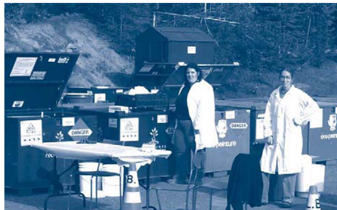
La collecte des RDD qui s'est tenue le 9 septembre dernier a permis aux résidents de se débarrasser de 4,2 tonnes de matières dangereuses.