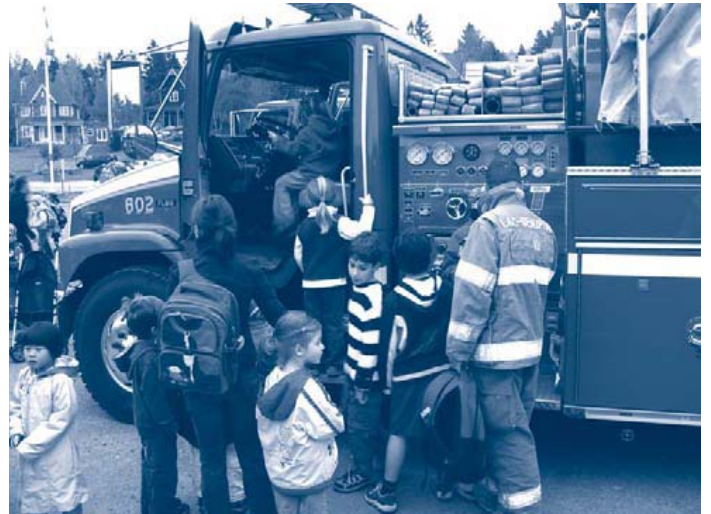
À leur arrivée devant l'école, les enfants ont été accueillis par les pompiers de Lac-Beauport et les policiers de la SQ qui, pour l'occasion, leur ont permis de monter dans leurs véhicules.

Le matin du mercredi 3 octobre dernier , des dizaines d'enfants accompagnés de leurs parents ont déambulé dans les chemins situés à proximité de l'école Montagnac dans le cadre de l'activité « Marchons vers l'école ». Cette année, c'est plus de 80 % des élèves de l'école Montagnac qui ont participé à l'événement.