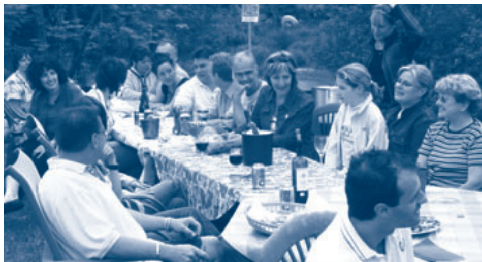
En 2006, les citoyens de Lac-Beauport ont organisé six fêtes de quartier qui ont réuni au total près de 300 personnes.

Déjà plusieurs résidents ont prévu organiser une fête dans leur quartier. Surveillez les affiches près de chez vous, vous recevrez peut-être bientôt une invitation de la part de vos voisins. Serez-vous de la fête ?