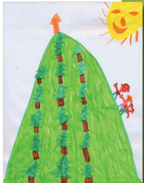
Félix Lebel, 8 ans