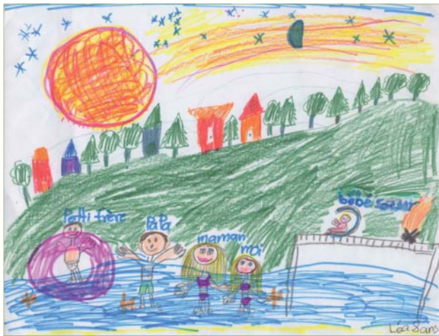
Léa Desmartis, 8 ans

Un concours de photographies a également été organisé, les meilleurs clichés illustrent le document.